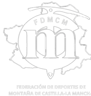
LOGO ORIGINAL PNG