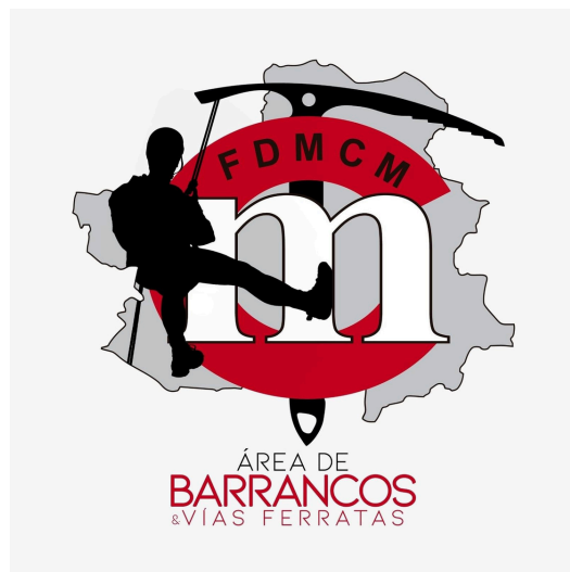
LOGO ORIGINAL JPG