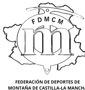
LOGO NEGRO PNG

Federación de Deportes de Montaña de Castilla-La Mancha