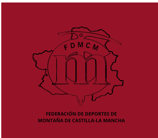
LOGO NEGRO JPG