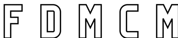
LOGO NEGRO PNG

Federación de Deportes de Montaña de Castilla-La Mancha