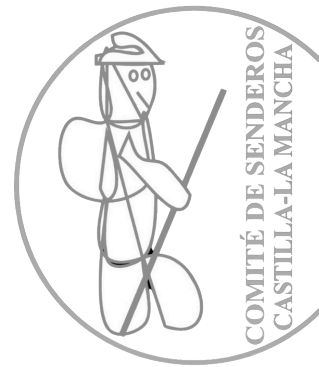
LOGO ORIGINAL PNG