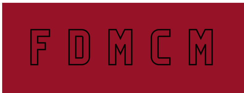
LOGO NEGRO JPG