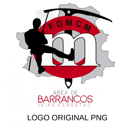
LOGO ORIGINAL PNG

Federación de Deportes de Montaña de Castilla-La Mancha