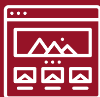
FOTO & VÍDEO