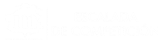
LOGO BLANCO PNG