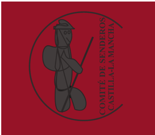
LOGO NEGRO JPG