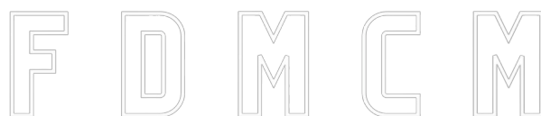
LOGO BLANCO PNG