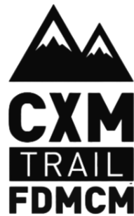
LOGO NEGRO PNG

Federación de Deportes de Montaña de Castilla-La Mancha